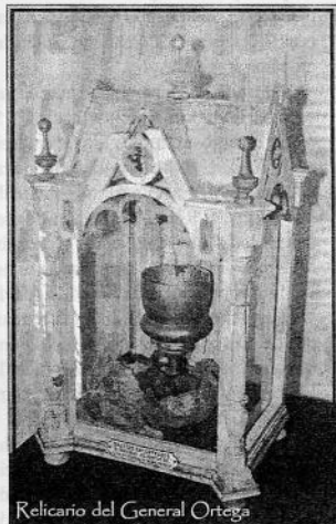
Relicario del General Ortega