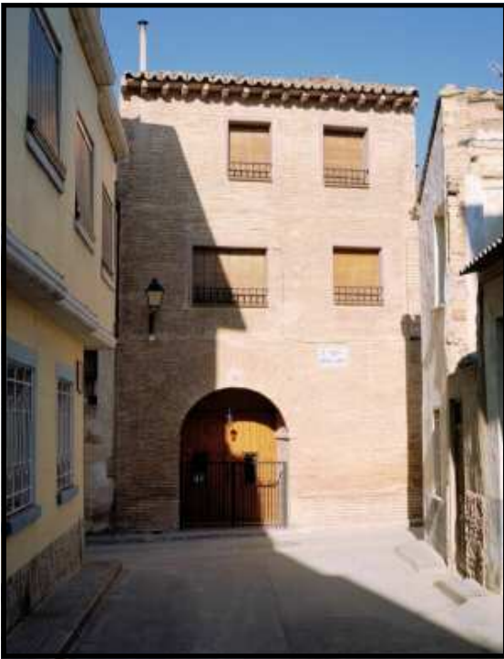
El Patiaz, (antiguo Ayuntamiento de la villa)

media de presencia judía del 15%. Son familias que permanecen estables a lo largo de toda la Edad Media. Suponían un segmento social especialmente activo, rentables para la villa de Tauste de los que el rey no podía prescindir y que consideraba de su propiedad.