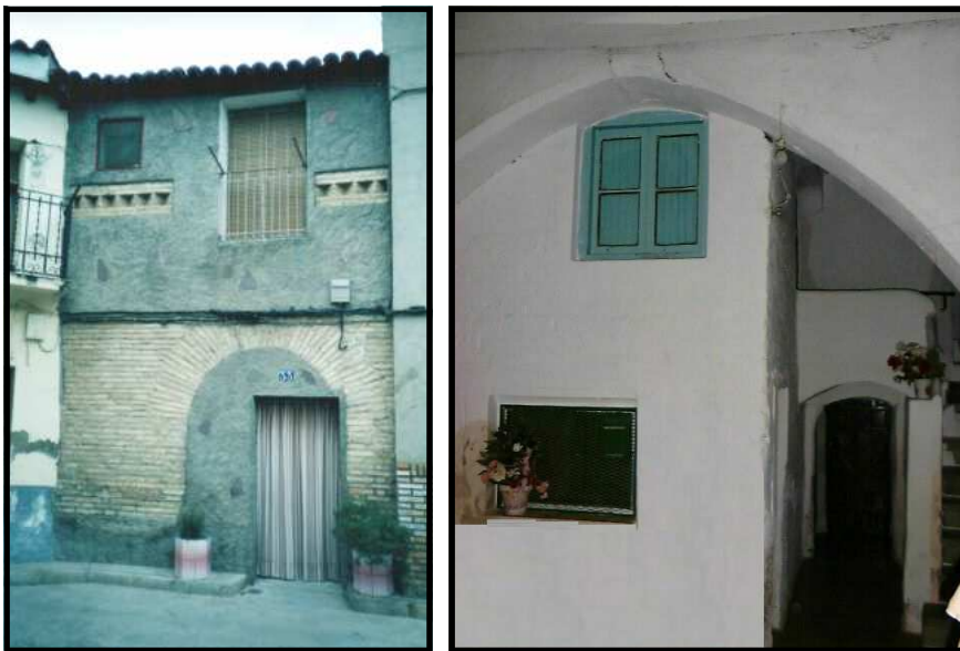
Casa en la judería de Tauste y patio interior.

La huella dejada en Aragón no fue específicamente judía sino que los judíos construyeron al estilo musulmán o gótico, que sus poetas y filósofos se expresaron –maravillosamente- en árabe o en castellano, que sus artesanos fabricaron sus mejores obras con gran capacidad de adaptación. Las huellas de los judíos hay que buscarlas en esa semilla invisible que forma ya parte de la esencia de la región, influyendo desde dentro, conformando el ser de los aragoneses.