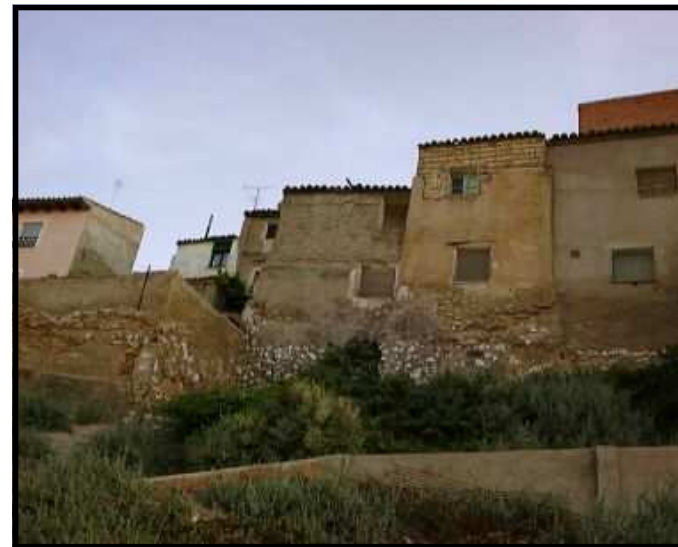
Restos de la antigua muralla que rodeaba la población

gios y la judería era territorio de Derecho Rabínico y no de Derecho Foral Aragonés.