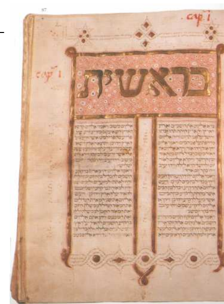
Biblia hebrea española, siglo XV.

El pueblo judío, desde la Diáspora, se repartió por el mundo con un solo documento de identidad: el Libro. De él extrajo su unión, su fe y su modo de vida. El libro mantuvo unidos a sus miembros por encima de ideologías y de costumbres que nunca llegarían a asimilar. Vivieron a su modo, observaron sus fiestas, prepararon a su modo sus comidas y si adoptaron el idioma fue para enriquecerlo y expresar a través de él sus necesidades, sus derechos.