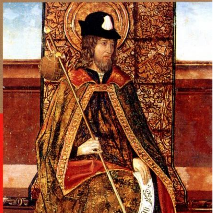
Santiago, detalle del retablo de Santa Ana de la ermita homónima, (conservado en la iglesia de Santa María).

Texto: Miguel Ángel Pallarés Jiménez.