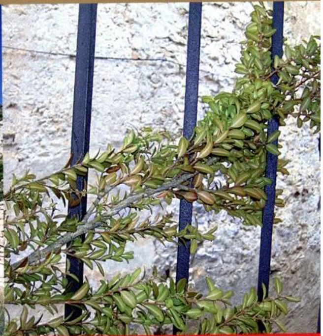
Ramo de boj bendecido, colgado en el balcón como elemento protector del hogar.