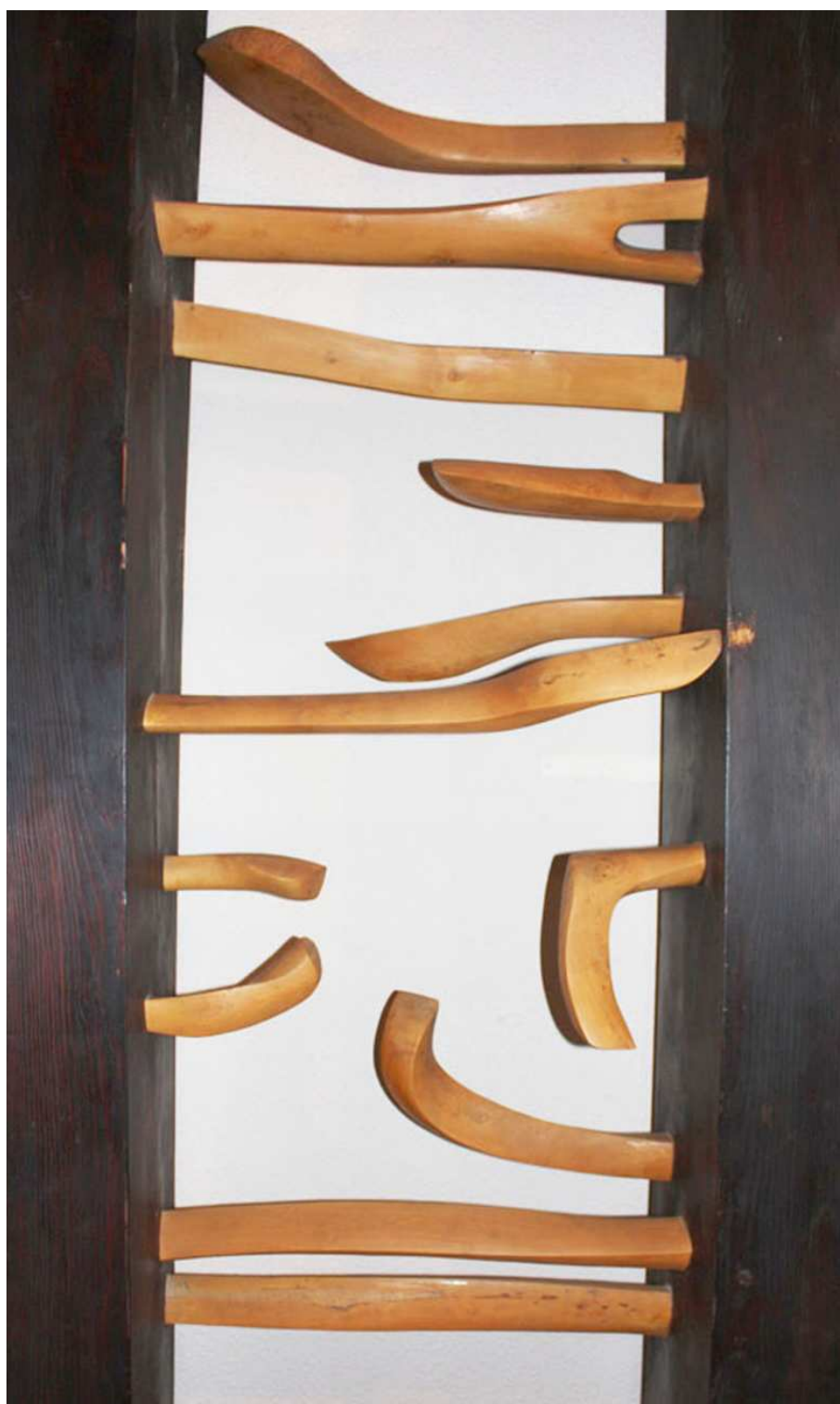
"Elemento elevador", escultura de Zacarías Pellicer situada en la Casa de Cultura